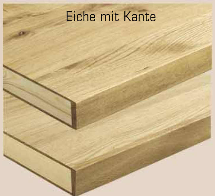
Eiche mit Kante