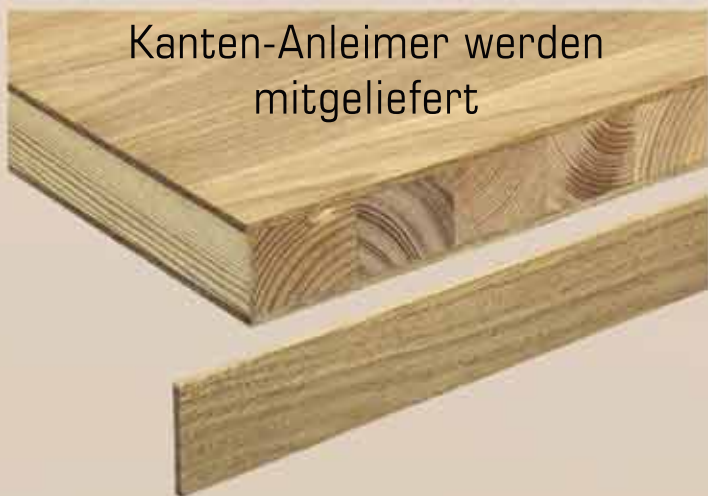
Kanten-Anleimer werden mitgeliefert

Besonders für Küchen sind die soliden und stabilen Arbeitsplatten geeignet.